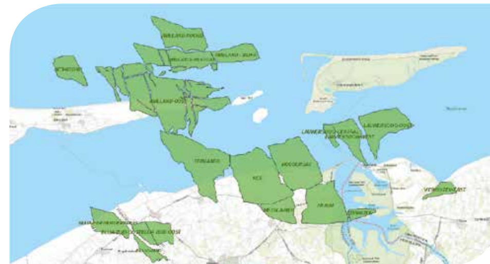
NAM wint al zo'n 30 jaar aardgas in deze omgeving. Het Ternaard-veld is nog niet in productie. De omliggende velden in de omgeving zijn wel in productie.

Nee, in de regio Dongeradeel zijn we al lang bekend. We winnen hier al tientallen jaren aardgas. In totaal plaatsten we 35 keer een boortoren. Zoals afgelopen winter bij Moddergat. Ook voerden we boringen uit bij onder meer Ee, Anjum en Engwierum. Elders in Fryslân, zoals bij Burgum, Blija en Ureterp is NAM ook al langer bekend.