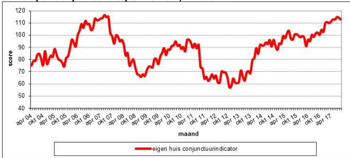
Figuur 2.3 De gemiddelde scores op de Eigen Huis Conjunctuurindicator, op maandbasis in de periode april 2004 – september 2017, in Nederland