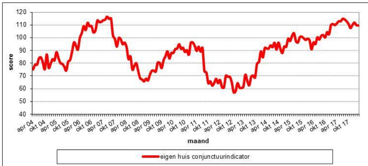
Figuur 2.3 De gemiddelde scores op de Eigen Huis Conjunctuurindicator, op maandbasis in de periode april 2004 – maart 2018, in Nederland