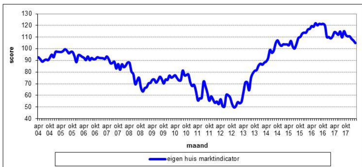
Figuur 2.1 De gemiddelde scores op de Eigen Huis Marktindicator, op maandbasis in de periode april 2004 – maart 2018, in Nederland

Bron: Boumeester, H., 2018, Eigen Huis Marktindicator. 1 e kwartaal 2018. Delft (TU Delft/OTB)